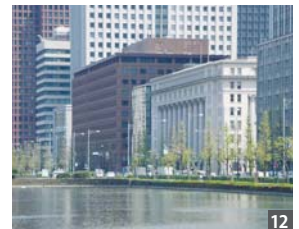
お濠越しに観た丸の内三井ビル。事務所はこのビルの7階です