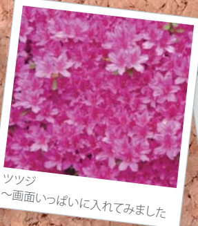
ツツジ ～画面いっぱいに入れてみました