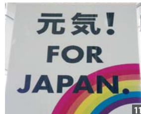
丸ビルの一階ホールに大きな垂れ幕が下がりました