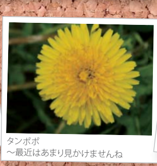
タンポポ ～最近あまり見かけませんね