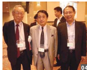
左が佐久間東京支部長。今総会で退任され、顧問に就任