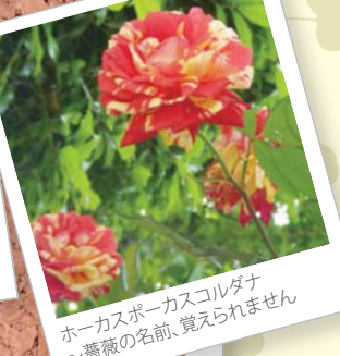
ホーカスポーカスコルダナ ～薔薇の名前、覚えられません