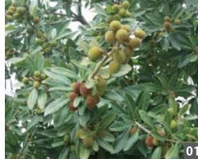
やまももの実がなっていたのでシャッターを切りました