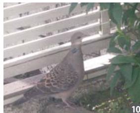
自宅の白木蓮の木に、つがいのキジバトがやってきました