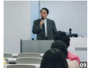
「何よりも『人間力』を磨くこと」を訴えました