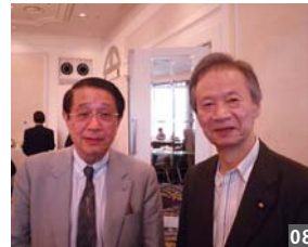
官邸の会議のため退席する江田法務大臣と