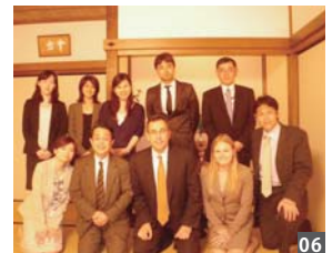
純粋な日本食のお店・招福楼で夕食をご一緒しました