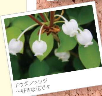
ドウダンツツジ ～好きな花です