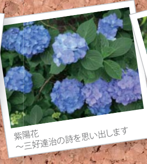
紫陽花 ～三好達治の詩を思い出します